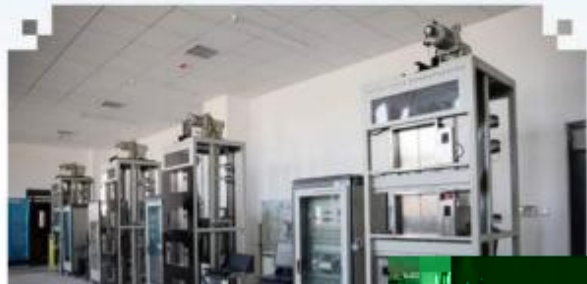
自动化生产线安装与 调试训练场所